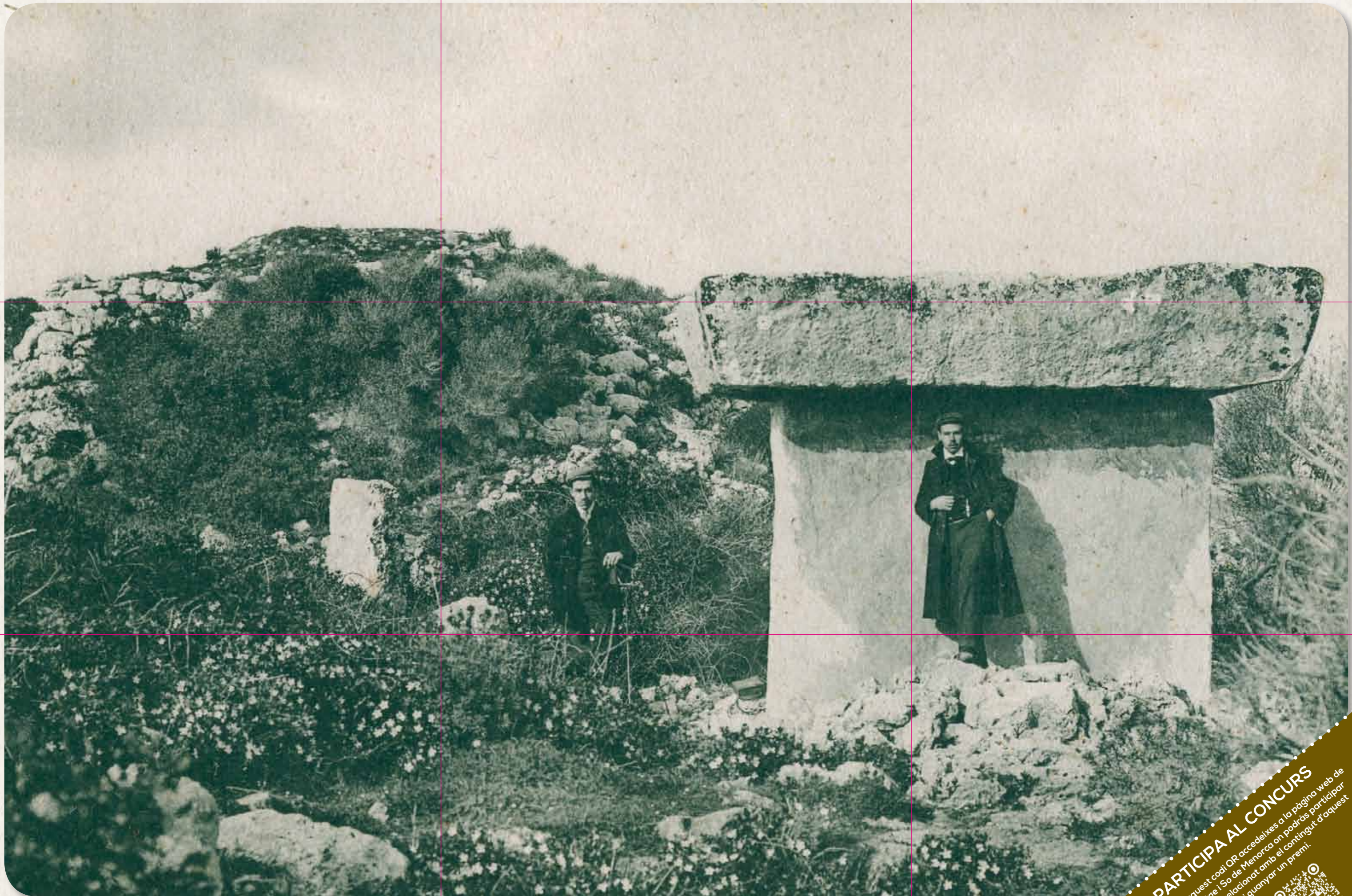
Taula i talaiot de Trepucó. Autor desconegut. Col·lecció Guillem Pons Buades. Arxiu d'imatge i So de Menorca-CIM. Postal

PARTICIPA AL CONCURS A través d'aquest codi QR accedeixes a la pàgina web de l'Arxiu d'imatge i So de Menorca on podràs participar en un concurs relacionat amb el contingut d'aquest plec i guanyar un premi.