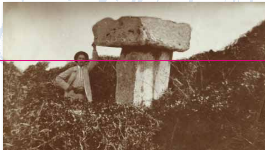
Fotografia de Sa Torreta de tramontana.