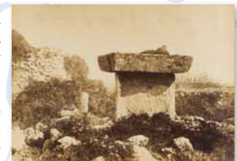
Trepucó. Autor J. Femenies. Fons Consell Insular de Menorca. Arxiu d'imatge i So de Menorca-CIM

En mi opinión, la isla de Menorca, es uno de los lugares más importantes para el estudio de la civilización primitiva de Europa. Con objeto de obtener una completa información, las excavaciones de estos sitios antiguos requieren el mayor cuidado; y entre tanto esto no se haga, tales sitios deberían ser preservados de la destrucción. Los megalitos de Menorca contienen de por sí un capítulo entero en la historia del mundo y pueden proporcionar información y conocimientos que en otras partes no pueden ser hallados.