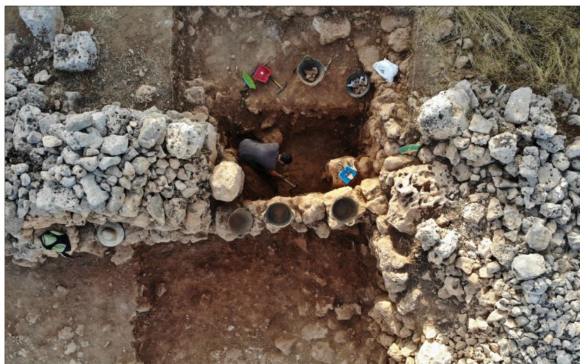
Imatge de les excavacions a la murada de Son Catlar.